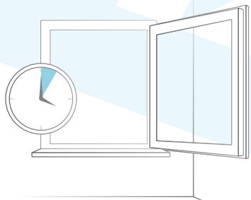
KRÓTKIE INTENSYWNE WIETRZENIE

Jeśli na Państwa nowych oknach pojawia się rosa, oznacza to, że są one zbyt szczelne. Powstający w pomieszczeniu mikroklimat powoduje „pocenie się” szyb, ram okiennych i pozostałych elementów okna. Jest to skutek skraplania się pary wodnej na ochłodzonych od zewnątrz powierzchniach. Regularne wietrzenie pomieszczenia eliminuje skraplanie się pary wodnej. Pomieszczenie należy wietrzyć krótko ale intensywnie. Najlepiej otworzyć wszystkie okna, aby nastąpiła w pomieszczeniu całkowita wymiana powietrza. Wietrzenie należy oczywiście powtarzać według potrzeb. Uchylenie skrzydła okiennego na stałe jest często niewystarczające.